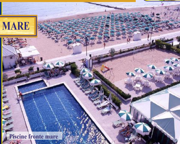
Piscine fronte mare